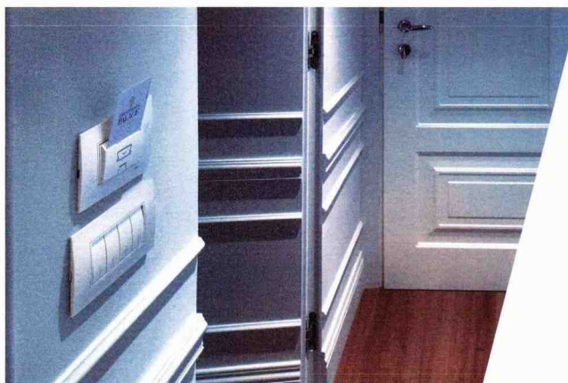
■ I flussi e gli scenari all'interno delle camere sono regolati dal sistema di controllo della serie Mylos di ABB, in grado di dialogare al meglio con la tecnologia KNX