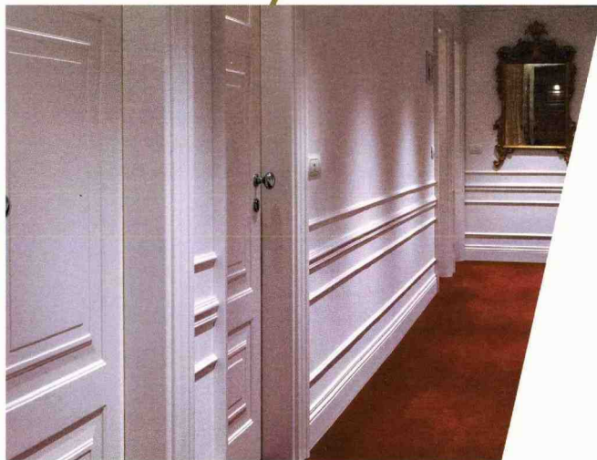
■ La serie civile MylosVelvet soddisfa perfettamente le specifiche esigenze estetiche degli ambienti

i-bus KNX, sistema intelligente di gestione e di controllo che assicura massima flessibilità e possibilità d'implementazione e consente sia di ottimizzare le prestazioni dell'impianto, sia di migliorare l'efficienza energetica. Senza dimenticare la sicurezza.