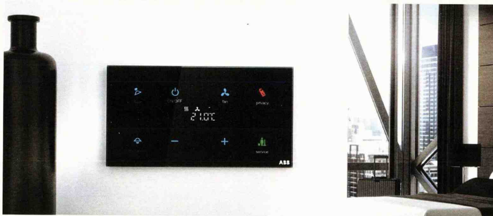
■ I nuovi sensori KNX tacteo, realizzati con superficie in vetro capacitivo, possono essere configurati singolarmente per la gestione di ambienti in edifici intelligenti quali gli alberghi di lusso

I dispositivi sono prodotti secondo standard ecologici internazionali, l'installazione è semplice con sensori cablati o wireless, attuatori e unità sensore/attuatore o componenti su guide DIN. Sistemi come ABB i-bus KNX e ABB-free@home consentono di configurare e azionare i dispositivi via software, App o connessioni al cloud e sono letteralmente a prova di futuro, oltre a garantire facilità d'installazione, di manutenzione e di gestione.